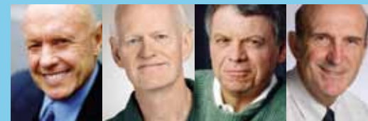
Stephen Covey Vrijdag 18 juni 2010

Dit seminar is het tweede seminar in een reeks van vier seminars in de periode juni 2010 november 2010. De andere seminars worden verzorgd door: Stephen Covey, John Kotter en Robert Quinn. Verwen uzelf met een opleidingstraject van formaat. Wanneer u zich inschrijft voor alle vier de seminars betaalt u er drie. En ontvangt u de Sony Pocket Reader t.w.v. 199 euro. Voor meer informatie verwijzen wij u graag naar onze site: www.focusconferences.nl .